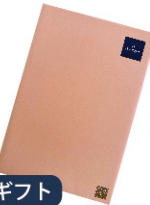
デラックスギフト・彩ギフト